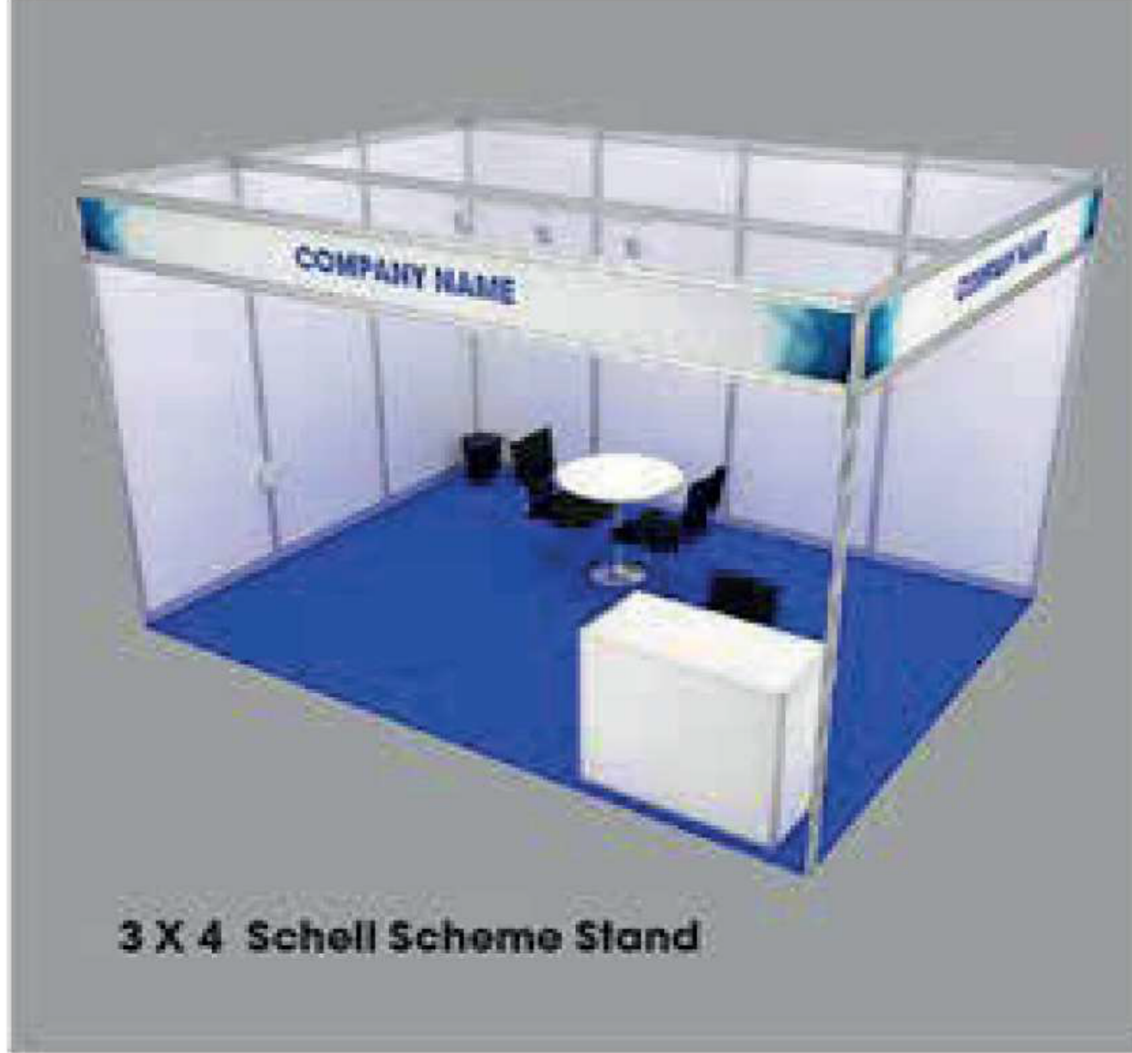
3 X 4 Schell Scheme Stand

قواطع لون أبيض و إطار المنيوم فضي 240سم × 100سم - سبوت لايت عدد 3 - وطلة كهرباء - طاولة عدد 1 + كرسي عدد 2 - سلة مهملات - سجاد (موكيت) - لوحة بإسم الشركة (عربي أو إنجليزي).